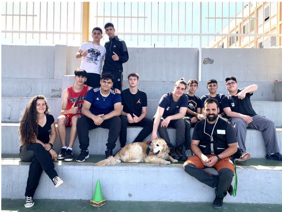
Ilustración 1 Grupo de usuarios tras realizar una sesión en EPLA.

Este proyecto tendrá un impacto social positivo en cuanto a la participación conjunta de personas de cualquier condición, el aprendizaje de claves de convivencia, el conocimiento de las necesidades de cada usuario y el trato correcto de un elemento tan presente en nuestra sociedad y hogares como son los animales.