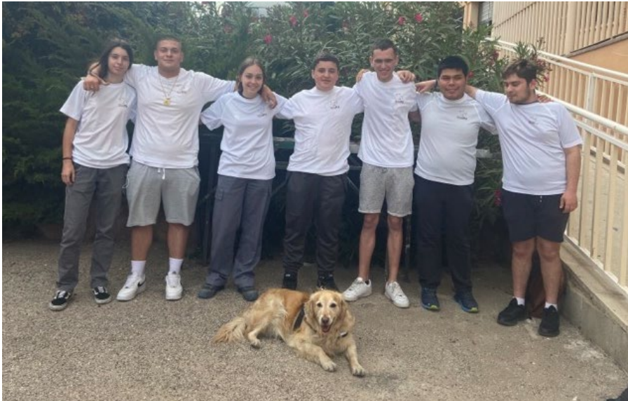
Ilustración 3 Miembros del equipo NEUL posando juntos

creatividad e imaginación cualquier persona pueda aportar ideas que ayuden a crear sesiones eficaces y divertidas.